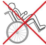
personne au fauteuil en bascule d'assise