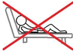
personne ayant glissé au lit