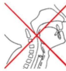
à ne pas faire tête en extension

Remarque : si le positionnement est difficile à maintenir, placer un coussin derrière la nuque