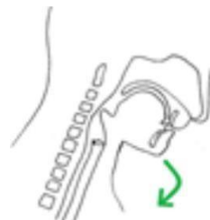
à faire tête en flexion

Lors de la phase de déglutition, privilégier un positionnement de la tête en flexion pour limiter le risque de fausse-route