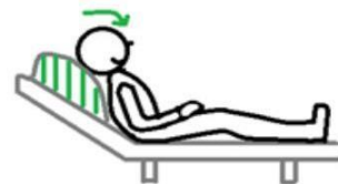
Demander à la personne de bien fléchir la tête en avant